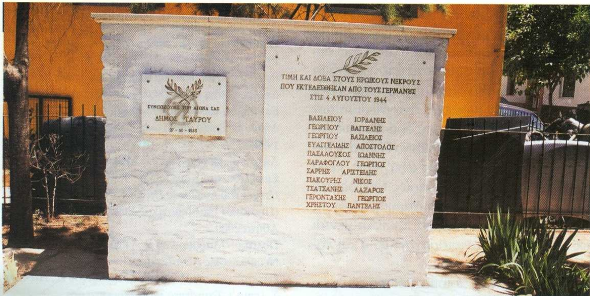
Μνημείο που έχει ανεγείρει ο Δήμος Ταύρου για τους Τσιγγάνους που εκτέλεσαν οι Γερμανοί στα Πετράλωνα το 1944

Συνοψίζοντας: Η αναγνώριση του «ξεχασμένου ολοκαυτώματος» -περίπου μισό εκατομμύριο Τσιγγάνοι έχασαν τη ζωή τους στα ναζιστικά στρατόπεδα συγκέντρωσης- αποτέλεσε βασικό αίτημα του ευρωπαϊκού και αμερικανικού τσιγγάνικο κινήματος. Δεν πρέπει ωστόσο να αγνοούμε και τους κινδύνους που ενέχει η χωριστή διαπραγμάτευση των διωγμών που υπέστησαν, στο βαθμό που υποδηλώνεται πως τα θύματα αποτελούν μια ξεχωριστή κατηγορία εξαιτίας της «διαφοράς» τους και ως εκ τούτου η αναγνώριση των διωγμών και της δράσης τους αποτελεί «δική τους υπόθεση». Πιο ρεαλιστικό και επιστημονικά ακριβές θα ήταν αυτή η διαδικασία να αποτελέσει τη βάση του αιτήματος να αποκατασταθούν οι Τσιγγάνοι ως ένα πλέγμα ομάδων με σύνθετη και πολλαπλή δημιουργικότητα που η ζωή και η έκφρασή τους αλληλοπεριχωρούνται και συνεξελίσσονται με την υπόλοιπη ελληνική κοινωνία και δεν εξαντλούνται στο γεγονός πως είναι Τσιγγάνοι.