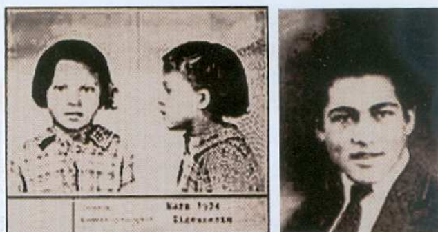
Τα αδέλφια Καρλ και Σείζα Στόικα, Τσιγγάνοι από τη Ρουμανία που μαρτύρησαν στο Άουσβιτς

Λαμπρό παράδειγμα αντίστασης αποτελούν τα αδέλφια Σείζα και Καρλ Στόικα οι οποίοι σε εφηβική ηλικία οδηγήθηκαν στο Άουσβιτς. Μερικά χρόνια μετά την απελευθέρωσή τους μπόρεσαν να διηγηθούν της ιστορία τους με λέξεις, εικόνες και –στην περίπτωση του Σείζα- με τραγούδι επίσης. Και οι δύο περιέγραψαν πώς το θάρρος και το παράδειγμα της μητέρας τους περιέσωσε τη ζωή και την αξιοπρέπειά του στο στρατόπεδο.