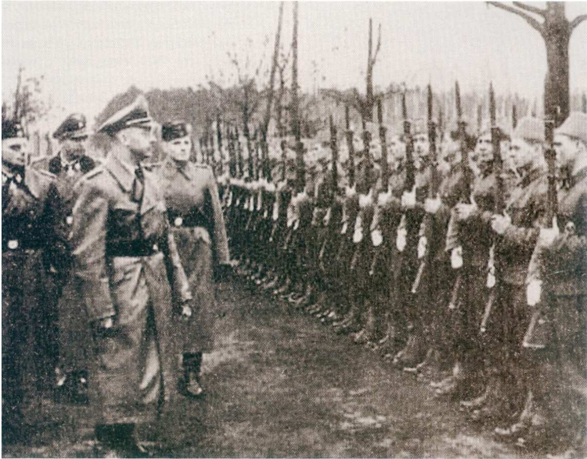
Ο Χίμλερ ηγήθηκε της εκστρατείας κατά των Τσιγγάνων. Εδώ σε «επίσκεψη» του στα Βαλκάνια. Επιθεωρεί τάγμα εθελοντών Βόσνιων μουσουλμάνων που πολέμησαν στο πλευρό του Αξονα

πορεία προς την Ευρώπη είχε προβεί σε επιγαμίες με άλλους λαούς και ως μια «μικτή φυλή» δεν είχε θέση στη ναζιστική Γερμανία. Ο ίδιος ο Ρίτερ προγραμμάτιζε μεθόδους αφανισμού ολόκληρης της φυλής με στείρωση.