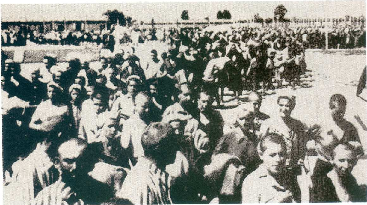
Το «τσιγγάνικο τρένο» φθάνει στο Αουσβιτς στα τέλη της άνοιξης του 1943 μεταφέροντας στο στρατόπεδο του θανάτου 20.000 Ρομά

Περίπου μισό εκατομμύριο Ρομά έχασαν τη ζωή τους στα ναζιστικά στρατόπεδα συγκέντρωσης. Χιλιάδες επιπλέον υπέστησαν εγκλεισμό ή άλλα καταπιεστικά μέτρα. Η αναγνώριση αυτού του ξεχασμένου ολοκαυτώματος αποτέλεσε βασικό αίτημα του ευρωπαϊκού τσιγγάνικου κινήματος. Σήμερα, η χωριστή πραγμάτευση των διωγμών που υπέστησαν δεν υποδηλώνει ότι τα θύματα αποτελούν μια χωριστή κατηγορία εξαιτίας της «διαφοράς» τους. Είναι μια προσπάθεια να ενταχθεί στη σύγχρονη ιστορία η παρουσία μιας ομάδας ευρωπαίων πολιτών την περίοδο 1940 - 45.