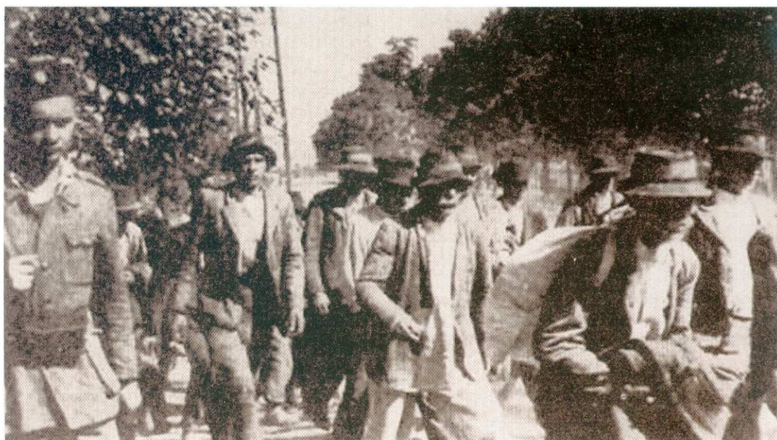
Τσιγγάνοι της Γιουγκοσλαβίας οδηγούνται στο στρατόπεδο συγκέντρωσης Γιασένοβατς της Κροατίας

Στις φυλακές και στο γκέτο της Βαρσοβίας οι Τσιγγάνοι έγκλειστοι εξεγέρθηκαν και επιτέθηκαν εναντίον των φρουρών. Πολλοί από αυτούς προσχώρησαν στους παρτιζάνους ή υπηρέτησαν στις ένοπλες δυνάμεις των χωρών τους, αλλά για τους περισσότερους δεν γνωρίζουμε παρά ονόματα κι ένα μέρος της ιστορίας τους. Από αυτόν το μακρύ κατάλογο ας αναφέρουμε στη Γαλλία τον Ανρί Ρουσέν, μέλος της Μακί και κρατούμενο του Μπούχενβαλντ, τον Αμπντουλάχ Κόπιλιε από τη σημερινή FYROM, αρχηγό στην αντιστασιακή οργάνωση του Τίτο και τον Χασάνι Μπραχίμι, ηρωική μορφή της Αντίστασης στη Γιουγκοσλαβία.