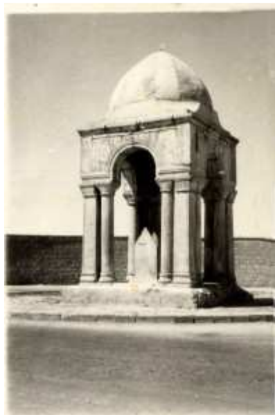
Tomb of the Girl in an undated photograph.